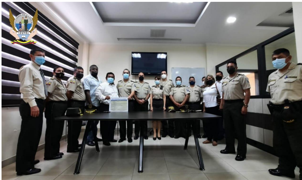
Entrega Simbólica de transferencia en el Hospital de la Policía Guayaquil N° 2

“Desde el principio hasta el fin, siempre hay alguien que te protege”