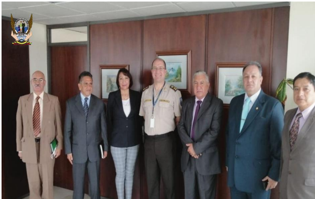
Reunión con los Srs. Suboficiales Mayores en servicio pasivo.

“Desde el principio hasta el fin, siempre hay alguien que te protege”