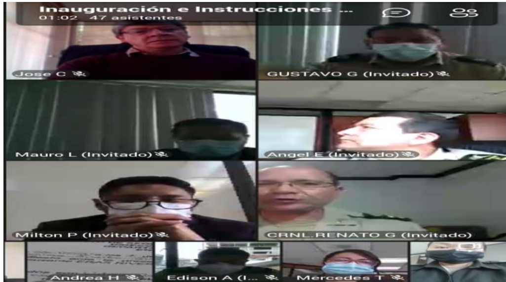
Inicio de las Capacitaciones impartidas por la Contraloría General del Estado