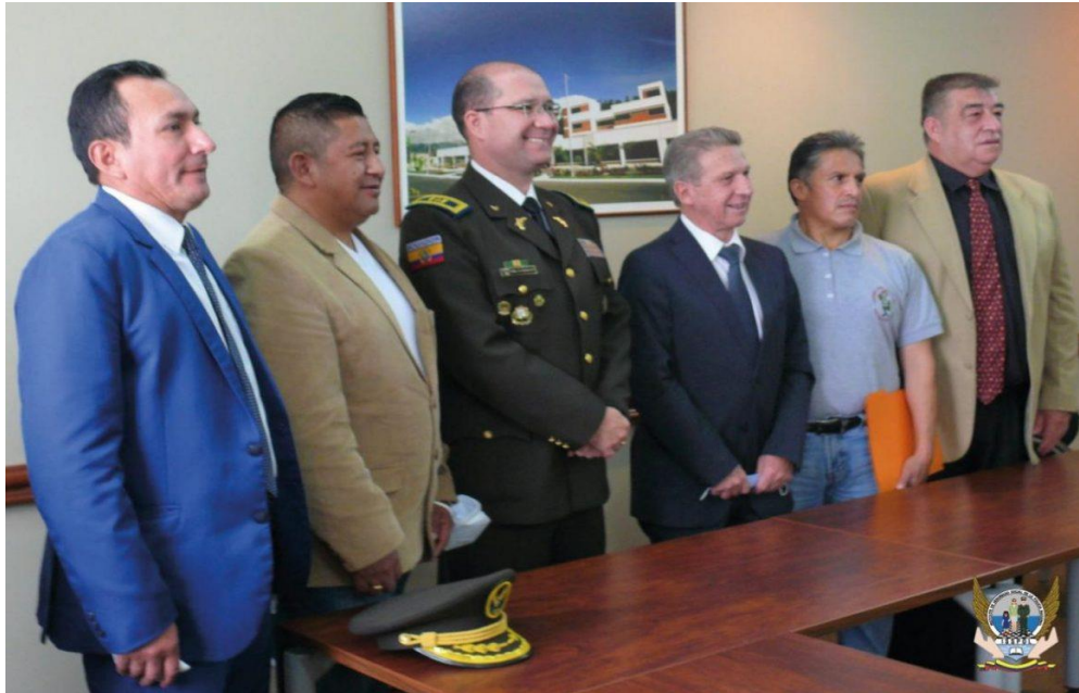
Firma de Convenio con SOLCA TUNGURAHUA