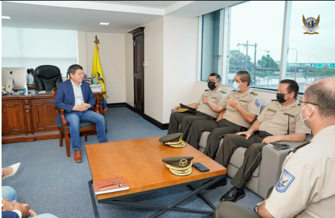
Firma de Convenio con la clínica de diálisis DIALRÍOS, de la Prefectura de Los Ríos.