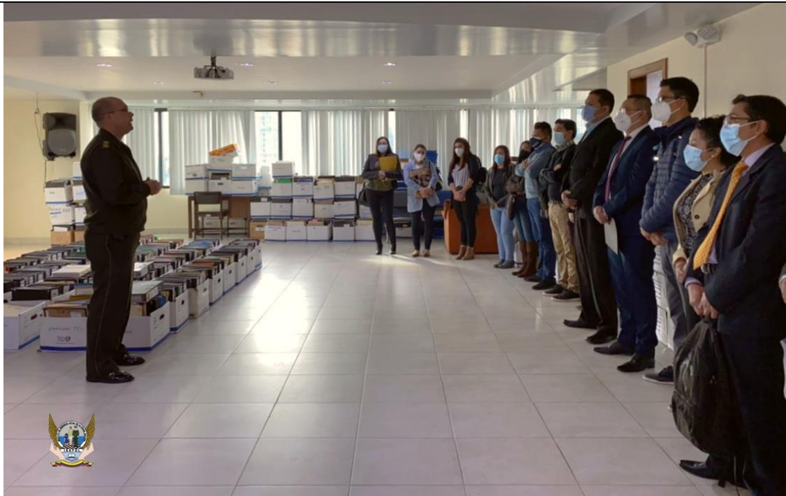
Incorporación de 15 auditores médicos y 5 liquidadores, bajo la modalidad de servicios profesionales.