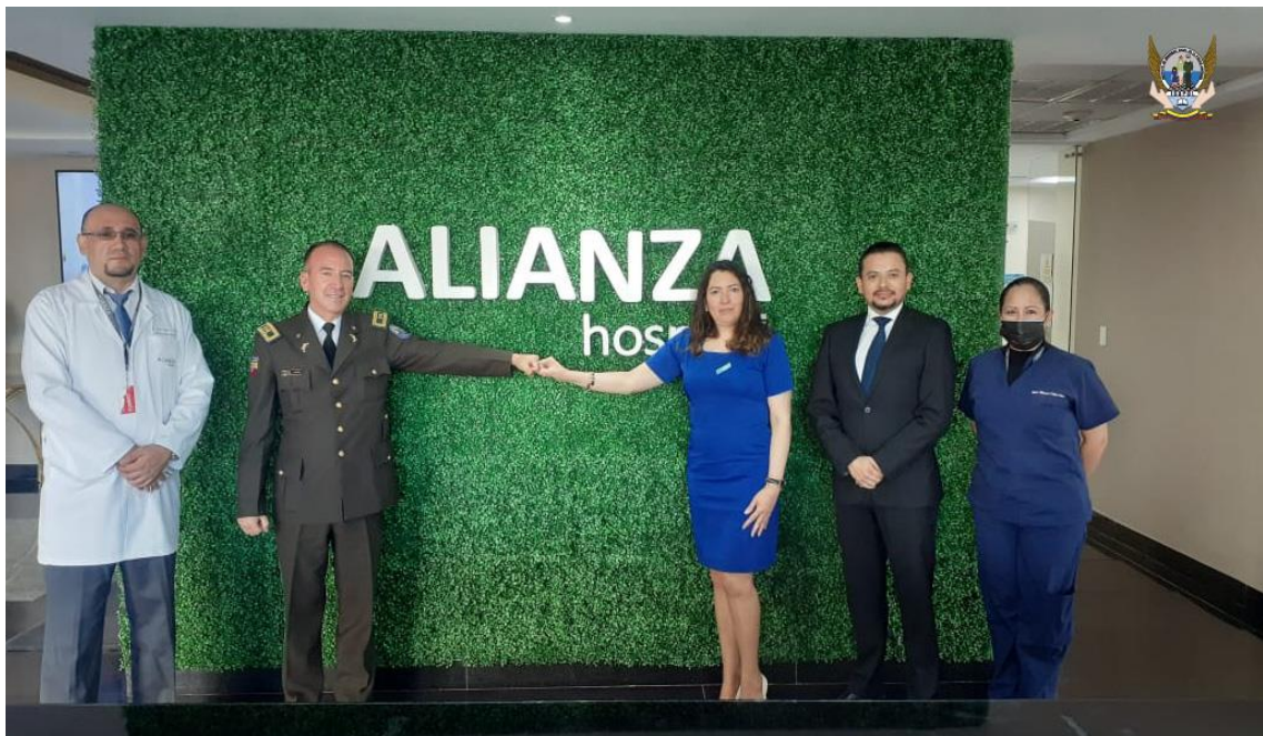
Firma de Convenio con HOSPITAL ALIANZA