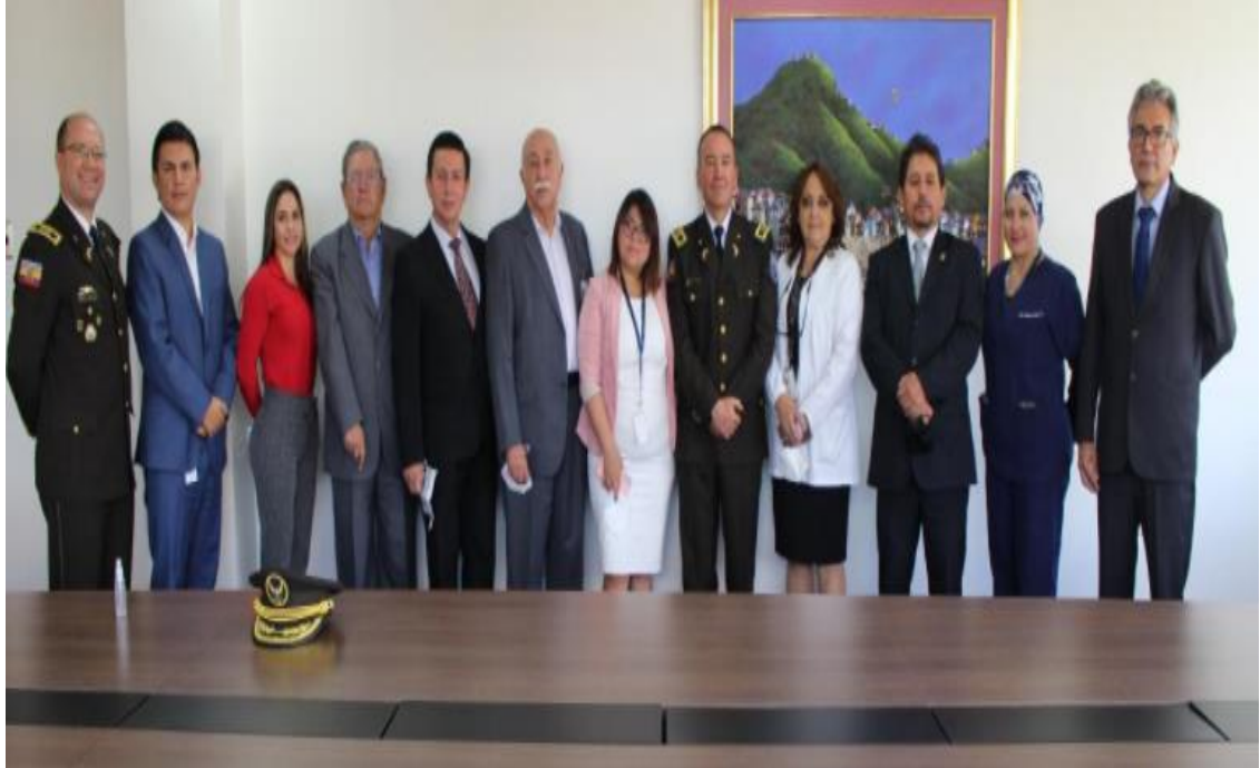
Oficialización de la reapertura de atención en SOLCA QUITO