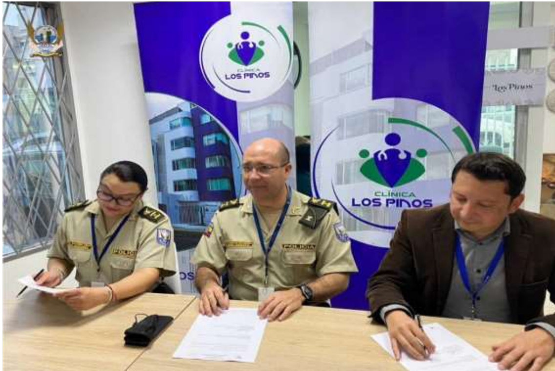
Convenio con el HOSPITAL GENERAL CLÍNICA LOS PINOS