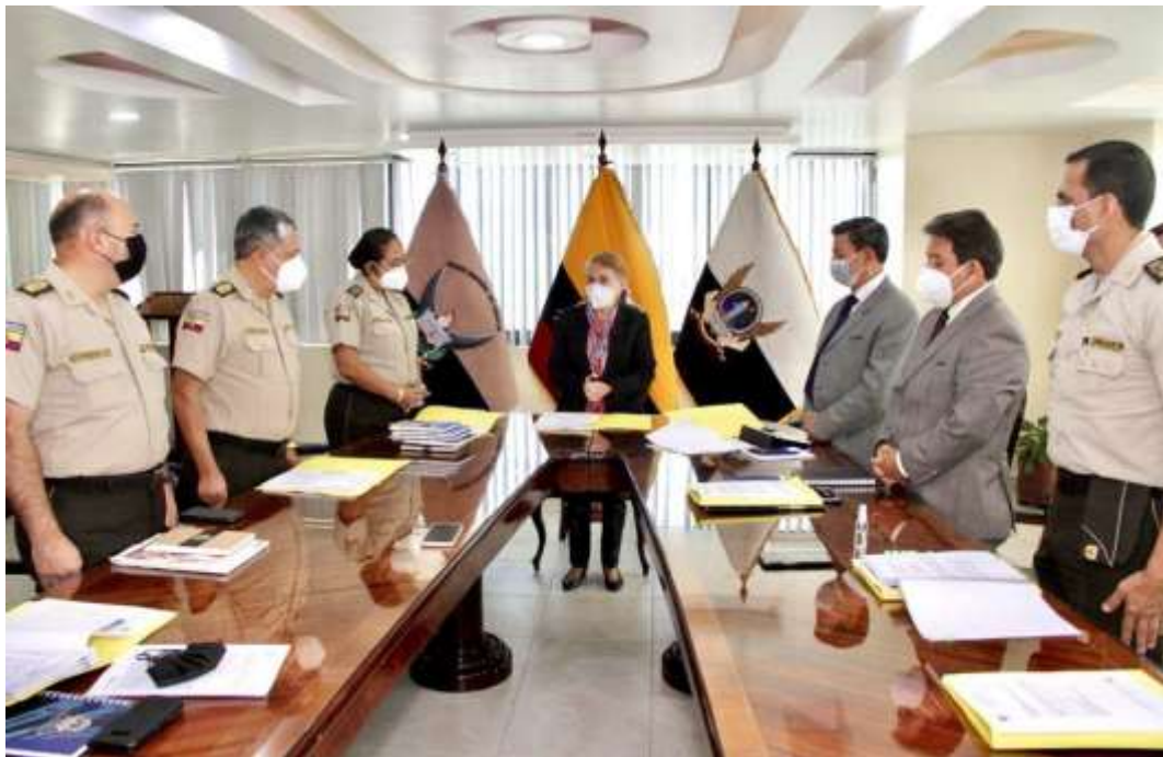
Posesión de la Sra. Ministra de Gobierno, como Presidenta del Consejo Directivo del ISSPOL

“Desde el principio hasta el fin, siempre hay alguien que te protege”