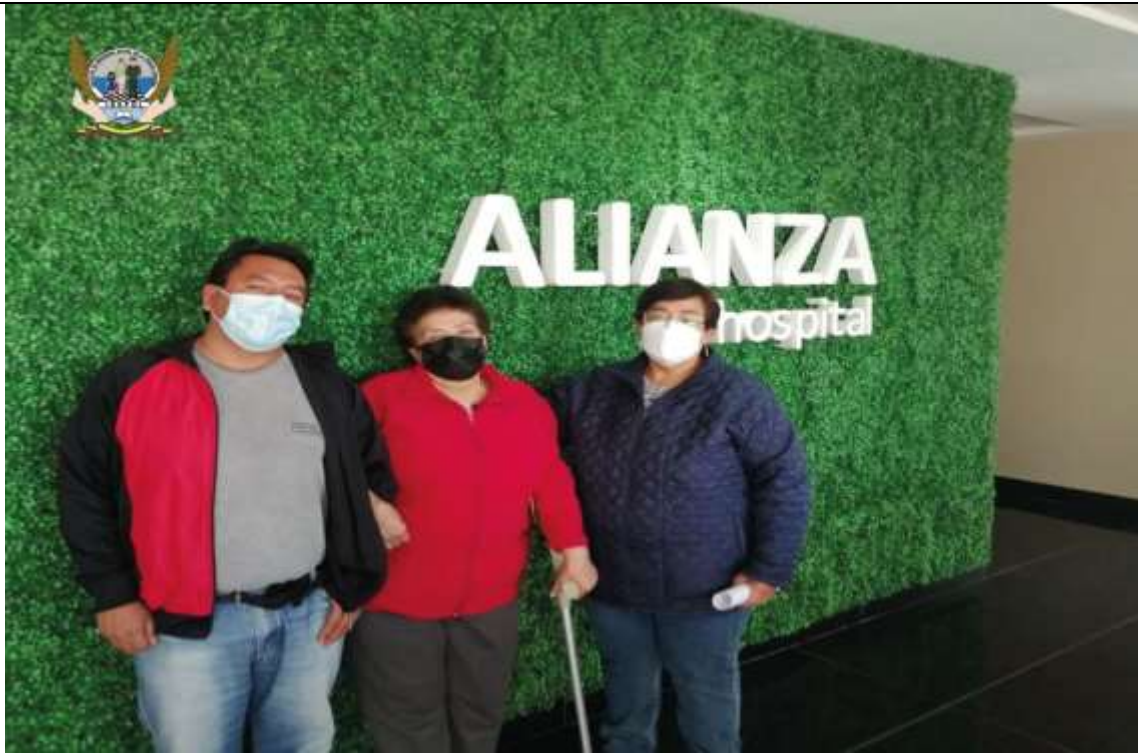
La Sra. viuda de un servidor policial en servicio pasivo recibe prótesis de cadera y rodilla, tras 2 AÑOS DE ESPERA

“Desde el principio hasta el fin, siempre hay alguien que te protege”